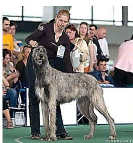
9. Бигль – 6 группа 10. Ирландский волкодав – 10 группа