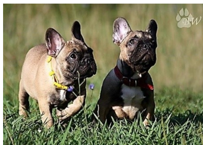
7. Скотч-терьер – 3 группа 8. Французский бульдог – 9 группа