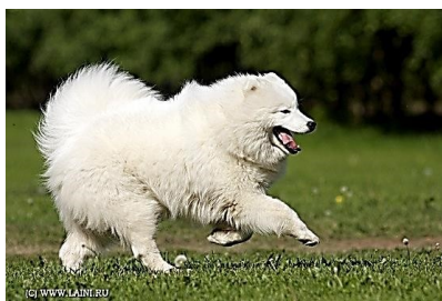
1. Вельш корги пемброк – 1 группа 2. Самоед – 5 группа