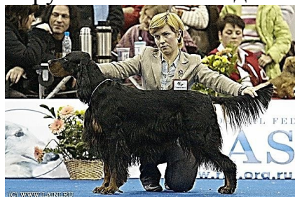
3. Цвергшнауцер – 2 группа 4. Шотландский сеттер – 7 группа