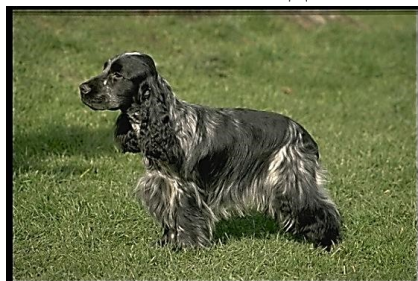
5. Такса – 4 группа 6. Английский кокер спаниель – 8 группа