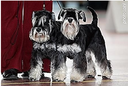
3. Цвергшнауцер – 2 группа