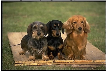
5. Такса – 4 группа