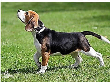
9. Бигль – 6 группа