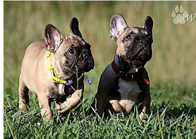
8. Французский бульдог – 9 группа