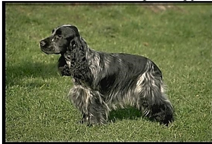
6. Английский кокер спаниель – 8 группа