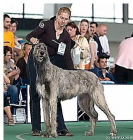
10. Ирландский волкодав – 10 группа