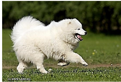
2. Самоед – 5 группа