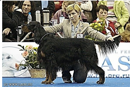
4. Шотландский сеттер – 7 группа