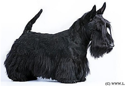
7. Скотч-терьер – 3 группа