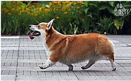
1. Вельш корги пемброк – 1 группа